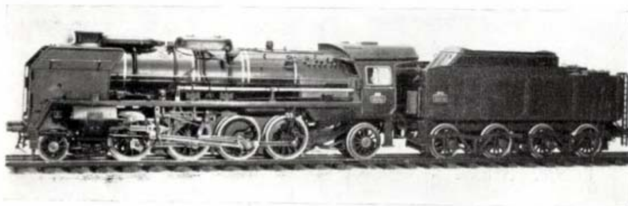
La locomotive 141 P - S. N. C. F. du Km 108.